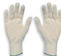
Gants en tissu lavables Taille homme et femme (panachage possible) - Écrus ou gris selon arrivage